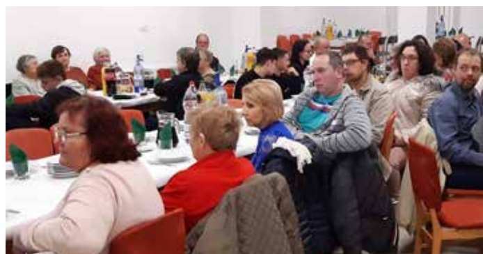
A kultúrházban ünnepi műsor és ízletes vacsora várta a mintegy száz műcsényi lakost

MŰCSÉNY Régi és közkedvelt hagyomány Műcsény településen a Mindenki Karácsonya elnevezésű rendezvény.