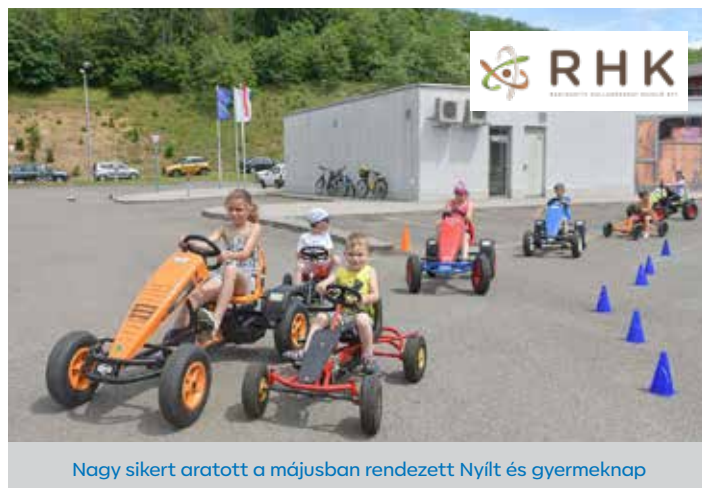
Nagy sikert aratott a májusban rendezett Nyílt és gyermeknap

elkészült egy háromszáznyolcvan oldalas tanulmány, amely a társadalmi-gazdasági hatásokat vizsgálja a nyugat-mecseki kutatási területünk környezetében. Ennek utómunkáiként idén még egy ötven oldalas kivonatot és egy infografikus brossúrát is készítettünk, e két utóbbi szintén felkerül hamarosan a honlapunkra. Készül egy közérthető rajzfilmsorozatunk is a radioaktivitás és az izotópfelhasználás témakörében – elsősorban a felsős diákok számára, de ez a munka még idén nem fejeződik be. Illetve részt vettünk még néhány hagyományos rendezvényen, például az Atomenergiairól Mindenkiné programozaton, amelyet az Országos Atomenergia Hivatal szervez – mindig más helyszínen – és a nukleáris szakma minden szegmensének képviselője részt vesz rajta előadásokkal, kiállításokkal. Valamint pályaaorientációs napon is jártunk az ESZI-ben, ahol a már jövőjüket tervező diákoknak mutattuk be munkánkat. Biztosan sok mindent kifejejtettem, de ha valaki nem szeretne lemaradni az aktualitásokról, akkor a Facebookon megtalál bennünket Radioaktív Hulladékokat Kezelő Kft. néven.