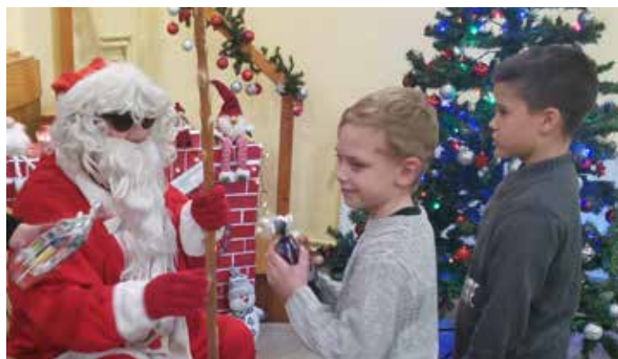
A gyermekek örömmel vették át ajándékaikat a jóságos Mikulástól

BÁTAAPÁTI Karácsony előtt kigyúlnak a gyertyák a közösségi tereken elhelyezett adventi koszorúkon. Így történt ez Bataapáti-ban is.