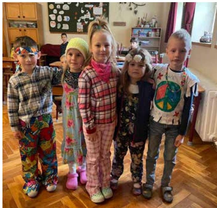
Az iskola első osztályos tanulói hamisítatlan hippie öltözékben

A csütörtök a fentiekén túl még egy meglepetéssel szolgált. Ugyanis alkalom nyílt – lehetőség szerint – a kor édességeinek nemcsak