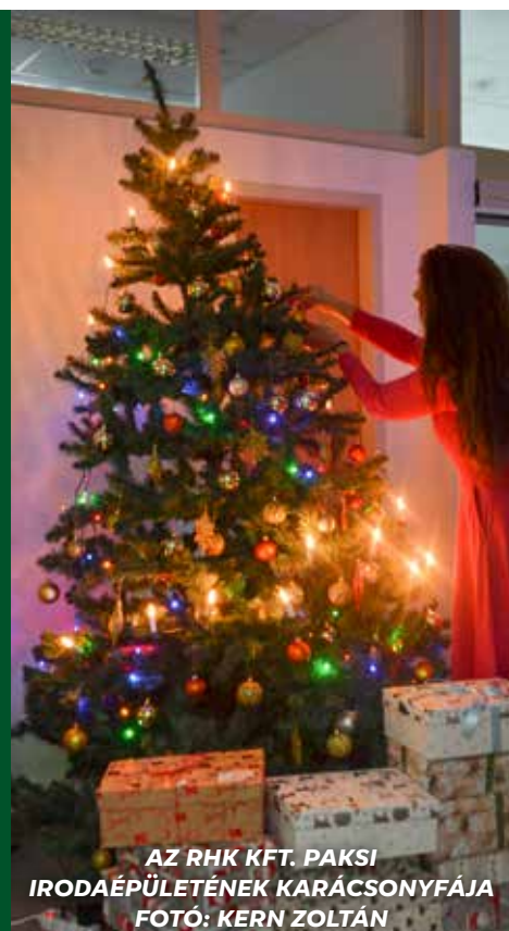
AZ RHK KFT. PAKSI IRODAÉPÜLETÉNEK KARÁCSONYFÁJA

Kellemes karácsonyi ünnepet és boldog új évet kívánunk minden kedves olvasónknak!