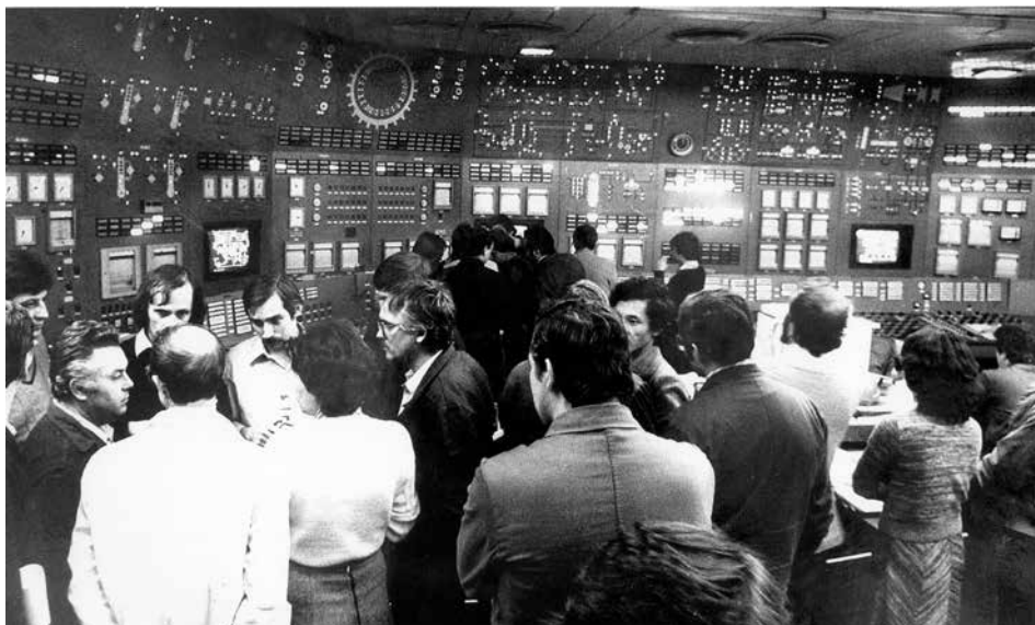
A hálózatra kapcsolás örök emlék maradt a résztvevőknek

A hatvanas években elkezdett tervezést, majd a Paksi Atomerőmű Vállalat 1976-os megalapítását követően tízezrek dolgoztak azért, hogy az ország villamosenergia-ellátása biztosítva legyen, munkájuk eredménye pedig most, negyven év után is meghatározó fontosságú mindenkinek Magyarországon.