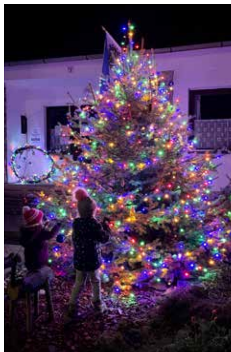
Az ófalusi fenyőfa, amit gyermekek és felnőttek egyaránt díszíthetnek

próbákon. A hálózatra kapcsolás örök emlék maradt a résztvevőknek. A kezdeti izgalom aztán magabiztos rutinná nőtte ki magát mind az üzembe helyezésben – 1984-ben csatlakozott a 2., 1986-ban a 3., 1987-ben pedig a 4. blokk a hálózatra – mind az üzemeltetés területén.