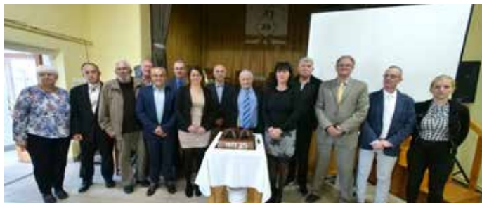
A TETT 2022 október 28-án, Bátapátiban ünnepelte fennállásának 25. éves jubileumát. A felvételen a TETT történetében szerepet vállaló, egykori és jelenlegi polgármesterek láthatók