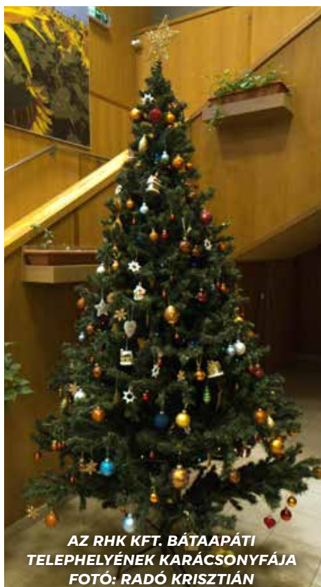
AZ RHK KFT. BÁTAAAPÁTI TELEPHELYÉNEK KARÁCSONYFÁJA

Kellemes karácsonyi ünnepet és boldog új évet kívánunk minden kedves olvasónknak!