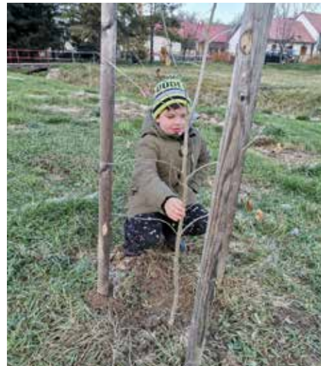
Facsemete a nagy park melletti részen, a Fő utca közelében

„Különös, hogy megemlékezésül nem kő- vagy bronzszobrot állítottak, hanem egy múlandó anyagot, a fát választották erre a célra. E gondolat nyomán az ebből a parkból induló fekedei német nemzetiségi tanösvény vezérmotívuma is a fa.”