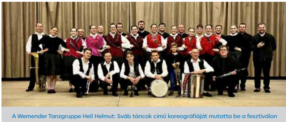
A Wemender Tanzgruppe Heil Helmut: Sváb táncok című koreográfiáját mutatta be a fesztiválon