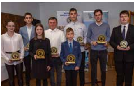
A négy korcsoportot képviselő díjazottak a gálán

BÁTASZÉK Negyedik alkalommal tartotta meg nagyszabású ünnepségét, a BSE Sport-Gálát a Bátaszék Sport Egyesület.